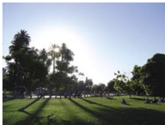
Cafe de Hansen lå i 1800-tallet i Palermo Park, som dengang var beboet af soldater.