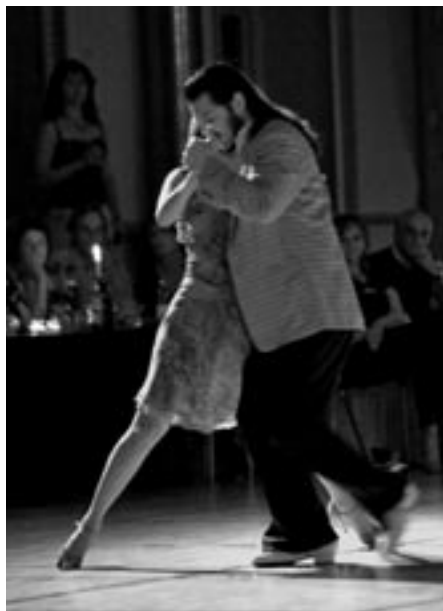
Show under tangofestivalen 2007.

Det blev foreslået, at bestyrelsesmøderne (kaffe og kage m.m.) finansieres af tangoforeningen. Der var et konkret forslag om at afsætte 5.000 kr. årligt til dette.