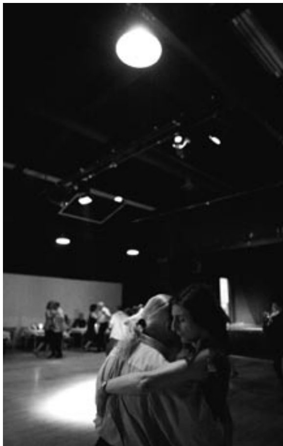
Fra tangofestivalen 2007.

samtale om de utallige finesser, tangoen kaster af sig på milongagulvene rundt omkring.