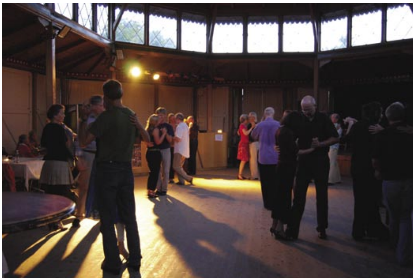
Fra Pavillonen i Sydhavnen 2007.