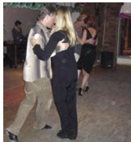
En milonga i St. Petersburg.

Flyafgang kl. 7.10 (russisk tider). Morgenkaffe hos Richard i Kastrup kl. 09.00. 🍷