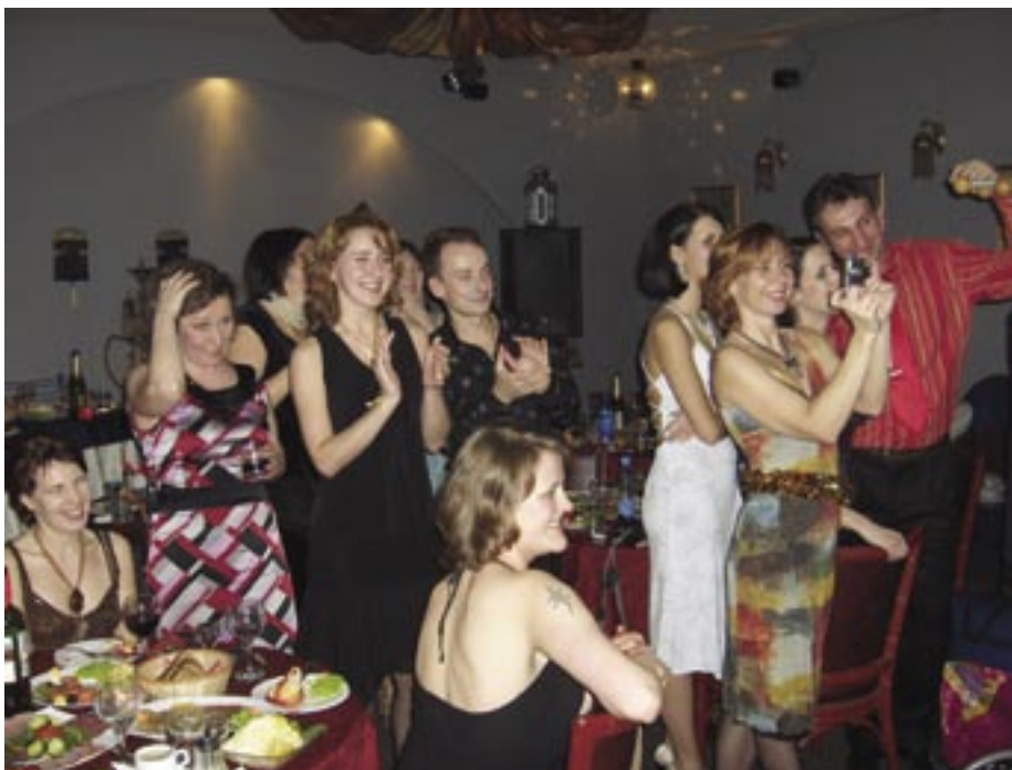
Nytårsmilonga i St. Petersburg.

Den 31: Året sidst dag på egen hånd. Det blev en meget lang gåtur langs "Fontanka"-kanalen, forbi vinterhaven til krydseren "Aurora". Den, der med sine kanoner udløste bolsjevikernes storm på Vinterpaladset.