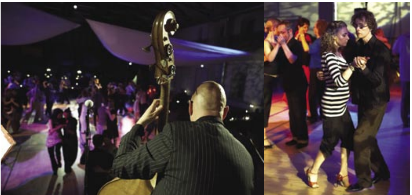
Milonga i Kedelhallen med orkestret Combo Tango.

Tre kvarter tager beslutningen om at gå. For alle er der jo, musikken spiller, og der er fem timer tilbage af festivalen. Men min bløde sofa kalder, jeg smækker benene op og falder øjeblikkeligt i søvn. Da jeg vågner og prøvende tager et par skridt, er jeg ved at tilte på de ømme forfødder. Tid til fodbad og massage, for i morgen skal vi til undervisning. Glæder mig allerede. ■